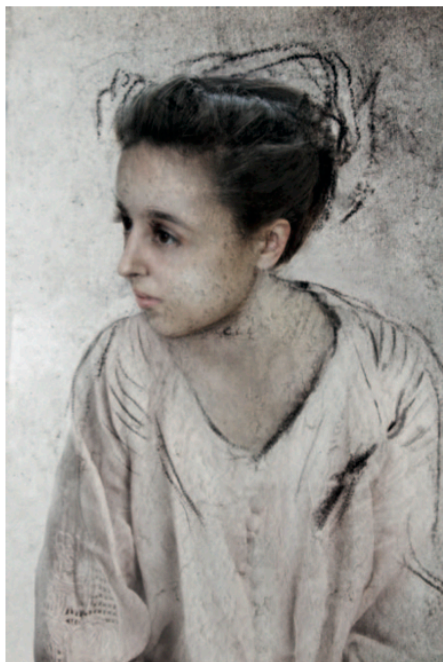
Sin Título (Watteau) 2009 Fotomontaje Digital. Impresión Lambda 119,5 x 86,5 x 4,5 cm 1/6