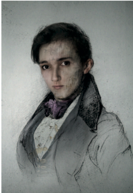
Sin Título (Ingres) 2009 Fotomontaje Digital. Impresión Lambda 119,5 x 88,5 x 4,5 cm 1/6