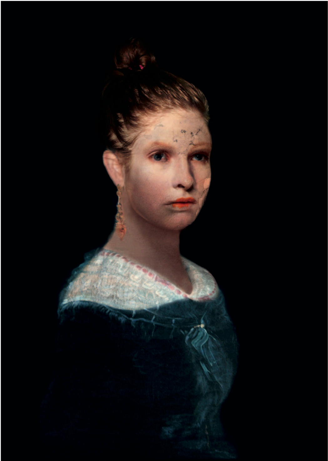
Ana Josefa (J. Gil de Castro) 2009 Fotomontaje Digital. Impresión Lambda 119,5 x 96,5 x 4,5 cm 2/6