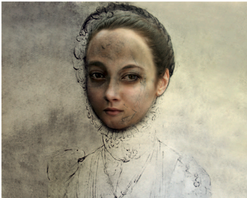
Sin Título (Cranach) 2009 Fotomontaje Digital. Impresión Lambda 120 x 100 x 4,5 cm Edición/ Edition: 3/6